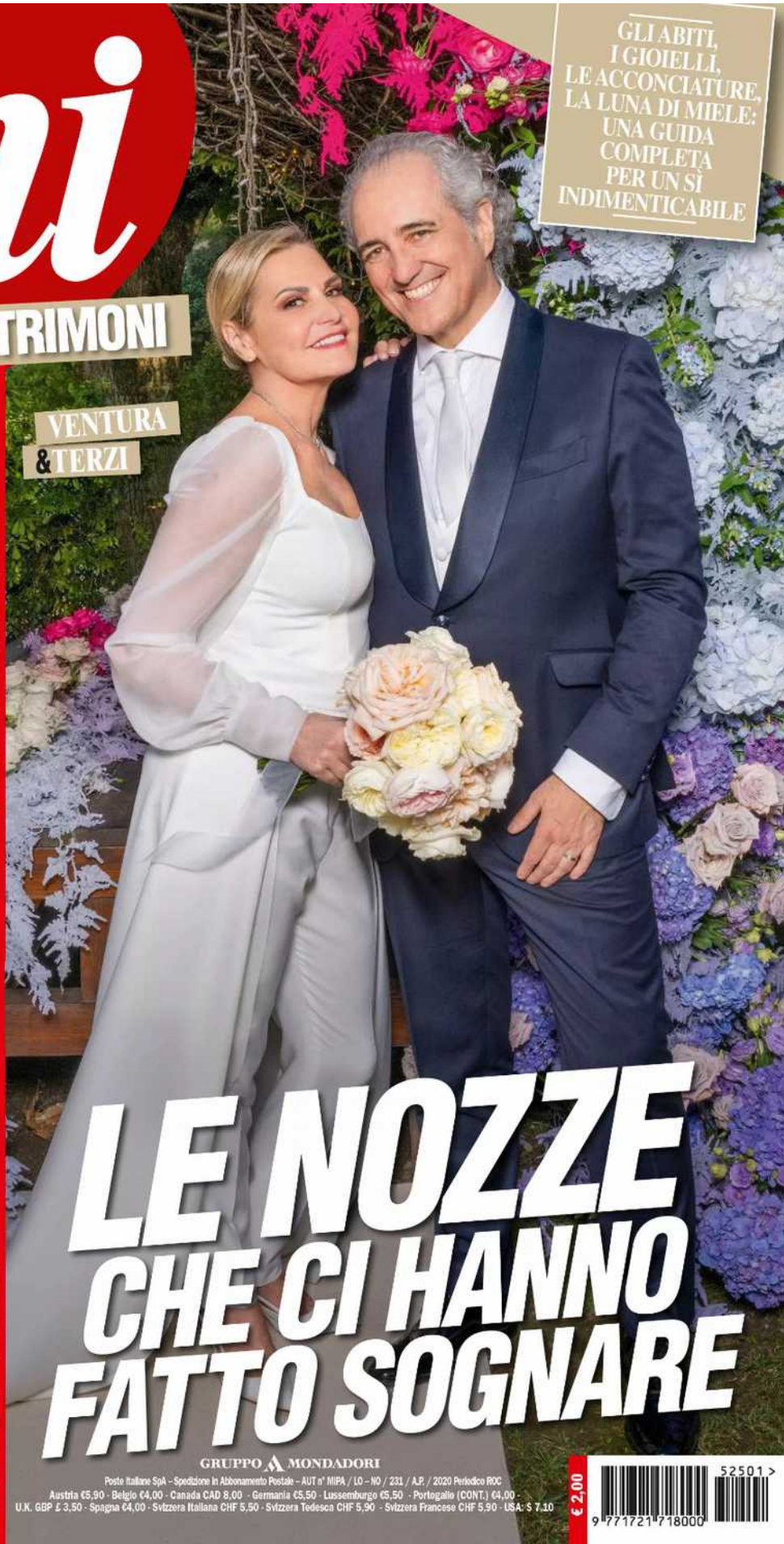
VENTURA & TERZI

GLI ALBUM PIÙ BELLI DEL 2024, DA CECILIA RODRIGUEZ A DILETTA LEOTTA, DA SIMONA VENTURA A CLIZIA INCORVAIA E TUTTI I "SI" DEI VIP CHE CI ASPETTANO NEL 2025