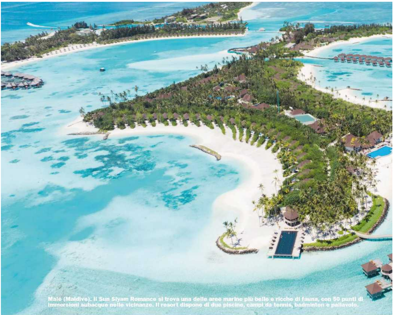
Maïé (Maldive). Il Sun Siyam Romance si trova una delle aree marine più belle e ricche di fauna, con 50 punti di immersioni subacquee nelle vicinanze. Il resort dispone di due piscine, campi da tennis, badminton e pallavolo.