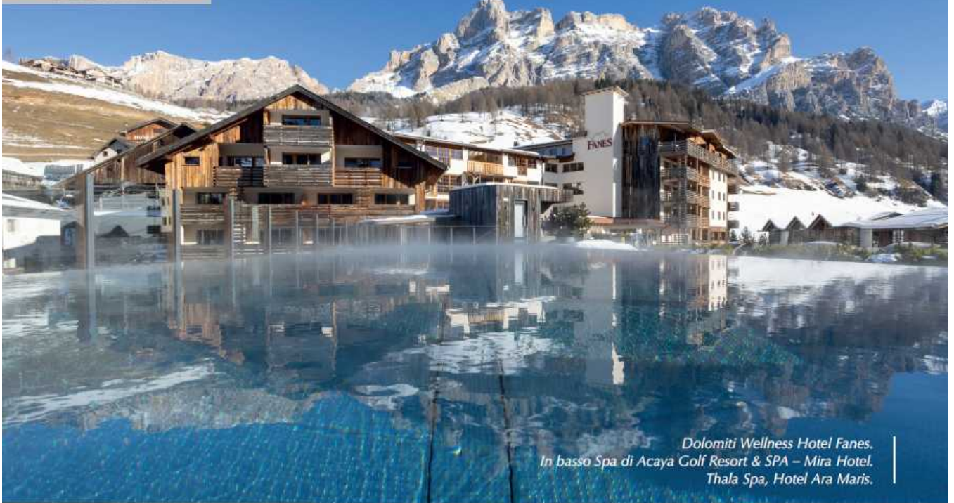
Dolomiti Wellness Hotel Fanes. In basso Spa di Acaya Golf Resort & SPA – Mira Hotel, Thala Spa, Hotel Ara Maris.