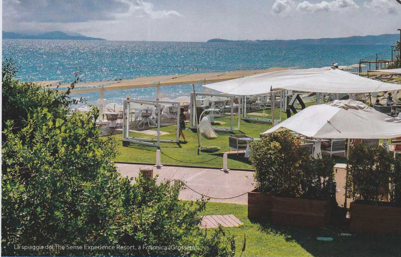
La spiaggia del The Sense Experience Resort, a Follonica (Grosseto).

Scorcio di Cala Violina, lungo la Costa degli Etruschi.