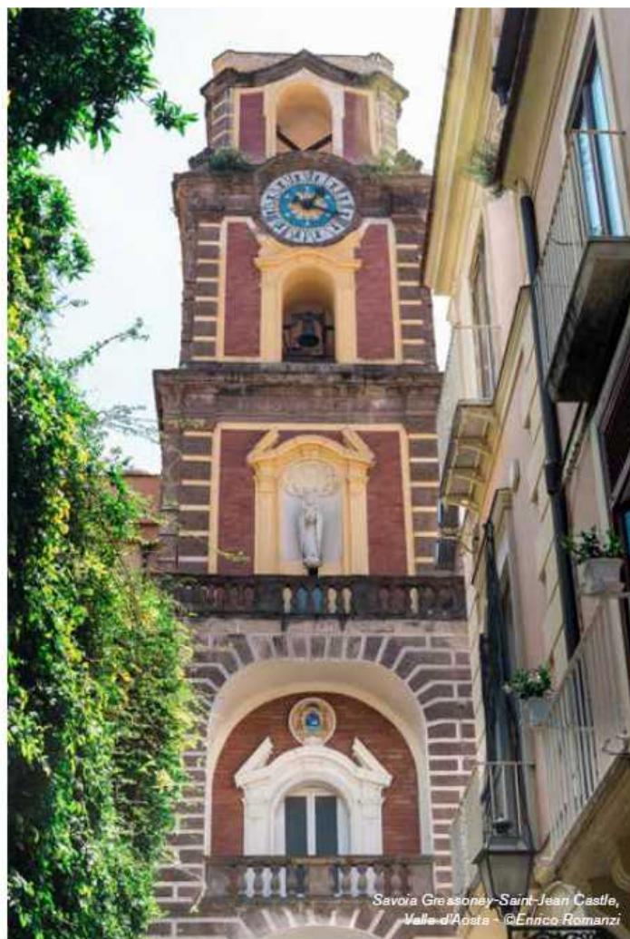
Savoia Grasonney-Saint-Jean Castle, Valle d'Aosta

Ara Maris ( www.aramarishotel.com ), hotel 5 stelle lusso, sorge nel cuore della splendida Penisola Sorrentina. Questo nuovo gioiello dell'hospitality abbraccia l'accoglienza come filosofia di vita, con un design unico che cattura l'essenza e l'energia tipica di Sorrento e della natura circostante lungo tutta la costa. Gli arredi e le aree comuni si integrano armoniosamente con il paesaggio, coniugando eleganza e sostenibilità, offrendo un ambiente confortevole e sofisticato. Gli spazi sono concepiti per promuovere bellezza e como-