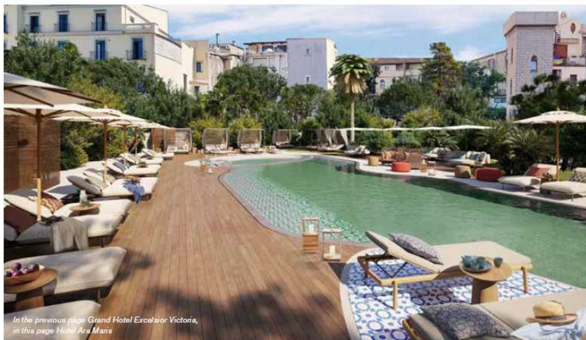
In the previous page Grand Hotel Excelsior Victoria, in this page Hotel Ara Maria

The Sorrento Peninsula is a vital agglomeration of fabulous traditions, which combine Neapolitan habits and customs with those of Salerno, creating a completely unique folklore manifested in the varied food and wine. The ingredients of each course are simple, but incredibly tasty: fruits grown in an almost completely uncontaminated land, such as the famous Sorrento lemons, the Piennolo del Vesuvio PDO cherry tomatoes and the aromas and flours of the wheat grains grown under the high sun. Of course, fish also plays a main role here. Among the dishes not to be missed are Sorrento-style gnocchi simply flavored with mozzarella, tomato and basil, Sorrento-style squid filled with breadcrumbs or breadcrumbs, anchovies, mozzarella and other types of cheese and eggs, Sorrento Babà which as per tradition, is not soaked in watered down rum, but in limoncello. If you are a cheese lover, then don't miss the Provolone del Monaco considered a jewel of the Campania gastronomic tradition together with buffalo mozzarella which is the only one that can boast the D.O.P. designation of origin. Provolone del Monaco is made of stretched curd and, unlike caciocavalli, it has a tapered oblong shape. It is produced with very valuable milk that comes from milking the Agerolese breed.