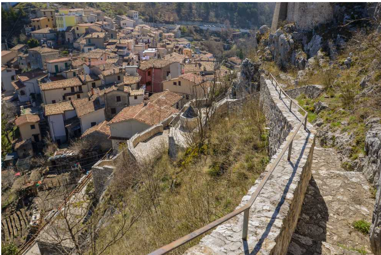
Scalinata della Pace di Cervara

A poca distanza da Roma si possono scoprire vere e proprie chicche come la Scalinata della Pace di Cervara, le meravigliose suggestioni di Civita di Bagnoregio o le lapidi con iscrizioni esoteriche di Anagni. Ogni vicolo di questi luoghi ha qualcosa da raccontare, ricchi come sono di storia e di arte. E per assaporare al meglio i dintorni della Capitale un indirizzo sicuro è quello dell'FH55 Grand Hotel Palatino, punto di partenza ideale dove comfort e tranquillità attendono anche il viaggiatore più esigente.